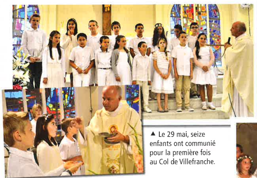
▲ Le 29 mai, seize enfants ont communié pour la première fois au Col de Villefranche.